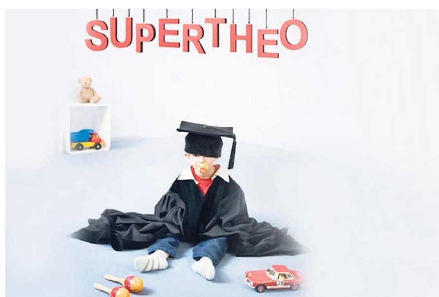
Der kleine Theo soll zum Wunderkind erzogen werden.

Der «Stadi» verlost 3 x 2 Tickets für die «Super Theo»-Vorstellung am 22. Dezember im Casinotheater. Wer am Donnerstag, 20. Dezember, zwischen 10 und 10.10 Uhr auf der Nummer 078 637 81 20 durchkommt, kann gewinnen. Viel Glück!