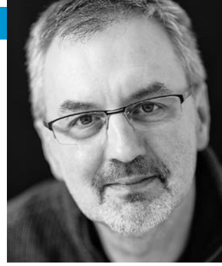
Anton Rothmund Fotograf aus Winterthur www.portraitphoto.ch

Andere sagen, dass meine Bilder authentisch, ästhetisch und manchmal etwas provokativ sind und mitunter zum Denken anregen. Was die Bilder m.E. unter anderem auszeichnet, ist wohl der Ausschnitt, der beim Fotografieren festgelegt ist und nicht mehr nachbearbeitet wird. Bei den Porträts/Aktbildern ist mir eine natürliche Haltung wichtig, Körperstellungen, die nicht authentisch wirken oder wo man Regieanweisungen herauslesen kann, sind langweilig. Bei den Körperbildern sind mir Einzelheiten, beispielsweise Falten oder Ähnliches wichtig.