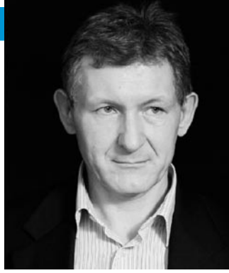
René Megroz Fotograf aus Winterthur www.arte-f-akt.ch

Die eigentliche Fotografie ist «nur» der Ausgangspunkt meiner Arbeiten. 95 Prozent der Zeit setze ich für das Postprocessing am Computer (meist mit Photoshop) ein. Witzige und spannende Szenarien zu erschaffen (sogenannte Composites), ist meine Lieblingsdomäne.