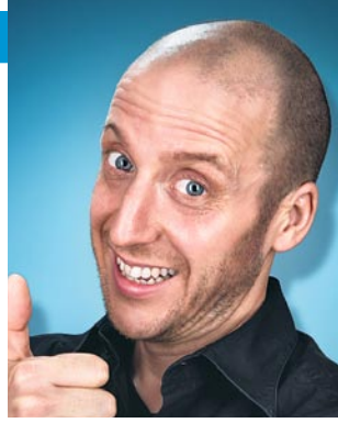
John Wilhelm Fotograf aus Winterthur www.johnwilhelm.ch

«photo 13», Maag-Halle, Hardstrasse 219, Zürich 4. bis 8. Januar 2013 täglich jeweils 11 bis 20 Uhr www.photo-schweiz.ch